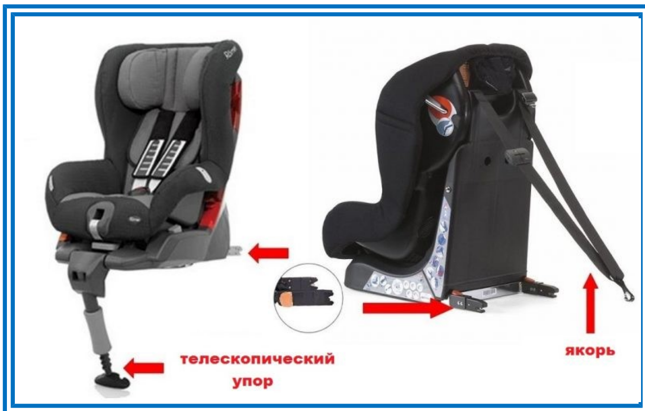
Рисунок 6. Телескопический упор и якорное крепление

Телескопический упор, который еще называют «упорная нога», чаще всего используется в автокреслах с системой Isofix для упора в пол автомобиля, что обеспечивает более жесткую фиксацию детского автокресла.